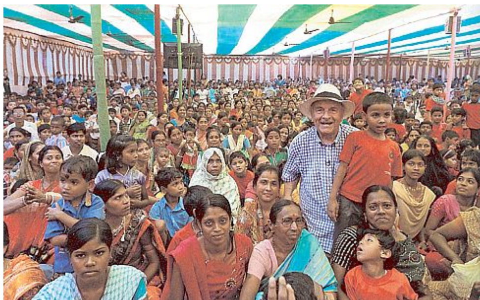
FOLLA Dominique Lapierre durante un incontro nella sua fondazione. Sotto, impegnato in una campagna contro la tubercolosi

«E' difficile: la realtà è la realtà. La mia arma è la mia penna. Con lei posso risuscitare gli avvenimenti, anche enormi, e dar loro colore. Anzi, sul mio tavolo di lavoro ho un cartoncino su cui sono scritte